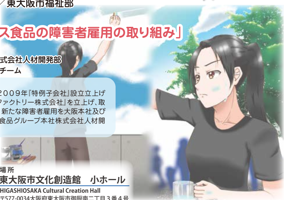
絵：藤戸美香さん(サポートスペースここりど)

1973年ハウス食品株式会社入社。2009年『特例子会社』設立立上げ チームに入り、同年12月『ハウスあいファクトリー株式会社』を立上げ、取 締役運営部長として9年間勤務。現在、新たな障害者雇用を大阪本社及び グループ各社に展開するため、ハウス食品グループ本社株式会社人材開 発部で勤務中。