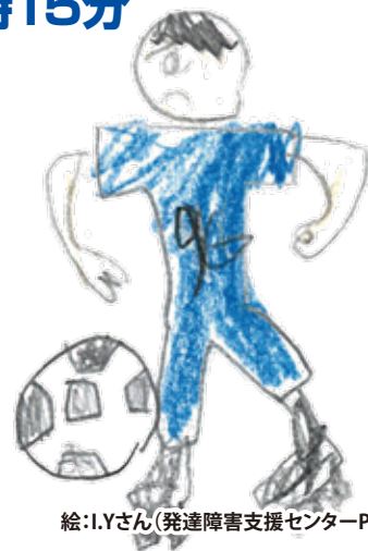
絵:I.Yさん(発達障害支援センターPAL)